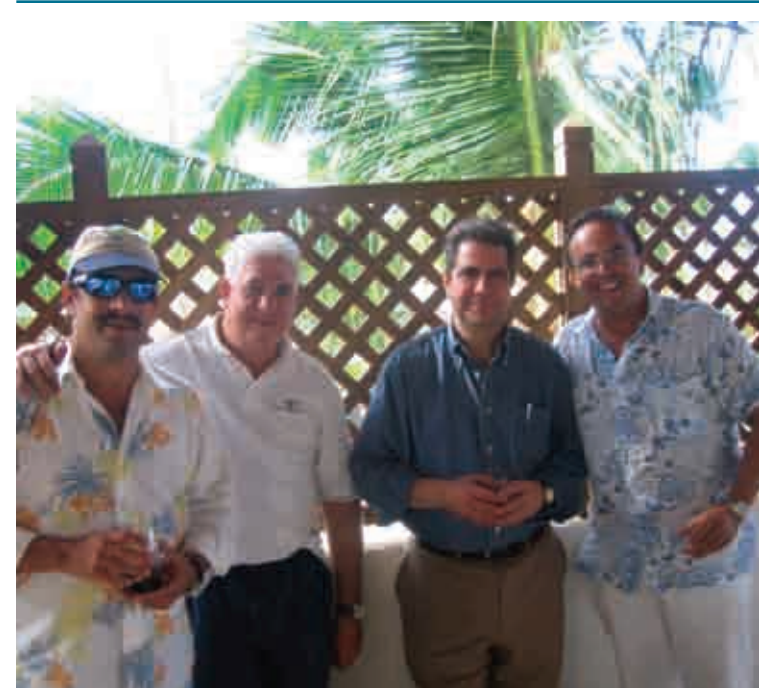
Secretario de Turismo visita y apoya el proyecto Balcones del Atlántico.

Balcones del Atlántico tiene la colaboración directa de los organismos estatales y de algunas instituciones no gubernamentales. De manera directa estamos siendo asesorados por la organización no gubernamental "Reef Check" que vela por la conservación y recuperación de los arrecifes de coral.