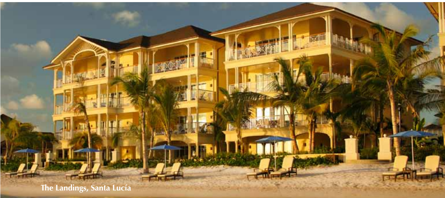
The Landings, Santa Lucía