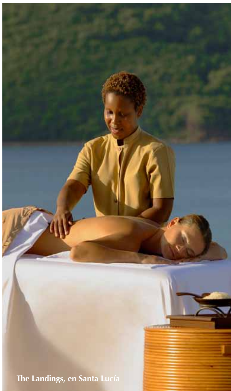
The Landings, en Santa Lucía

Para nosotros era de vital importancia aliarnos a una cadena hotelera de prestigio internacional, no sólo para invocar confianza en nuestros clientes con respecto al manejo del proyecto sino también para separar nuestro proyecto de otros proyectos en la región y proveerles a nuestros clientes un servicio excepcional y la oportunidad de colocar sus residencias en un programa de renta. Dada esta necesidad latente del mercado nacional e internacional hace aproximadamente un año iniciamos la búsqueda de una compañía hotelera con prestigio de marca y servicio. Durante este año sostuvimos reuniones con varios hoteles en Europa y Estados Unidos donde les presentamos el proyecto. Para nosotros fue una sorpresa y orgullo ver cuantas compañías se interesaron inmediatamente por el destino y por asociarse con un grupo como el nuestro. Para nosotros era de vital importancia que la compañía representara, al igual que nosotros, un símbolo de calidad y prestigio en su industria; y una compañía que tuviera experiencia en el manejo de este tipo de estructura o modelo de oferta hotelera, ya que el nuestro no es un hotel corriente sino que incluye el modelo de residencias. Después de muchos análisis, visitas, y reuniones seleccionamos la compañía que a nuestro criterio cumplía y excedía con todas nuestras expectativas: Rock Resorts.