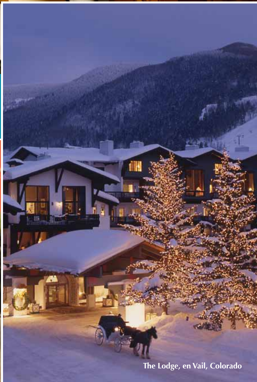
The Lodge, en Vail, Colorado